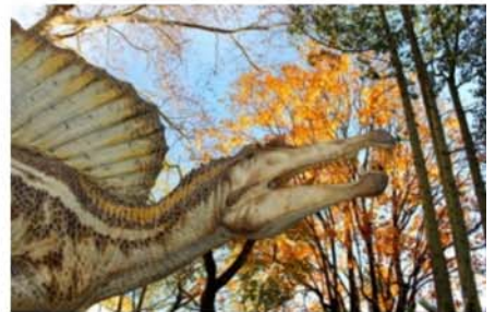
Dinosauri in Carne e Ossa